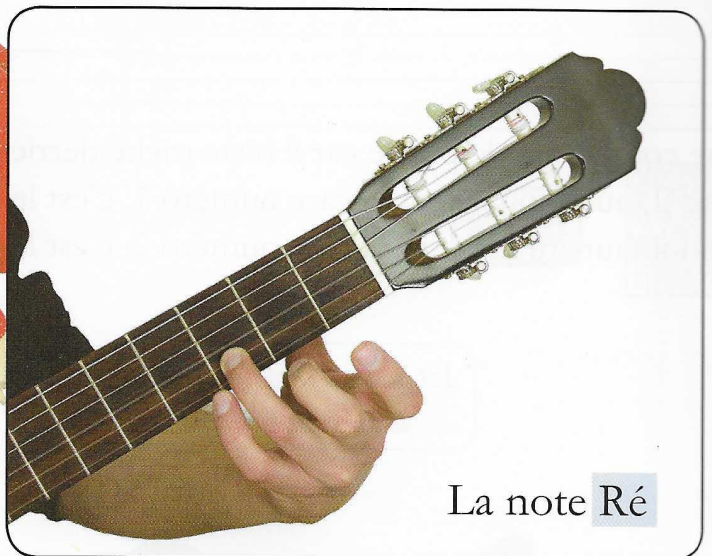
La note Ré