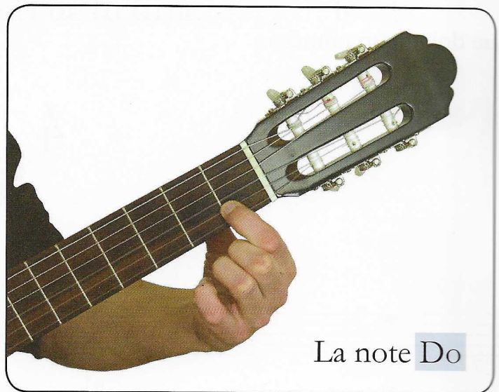
La note Do

On la joue sans la main gauche ! Mais la main droite doit quand même gratter la bonne corde.